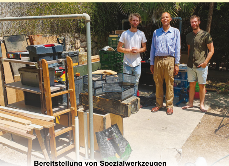
Bereitstellung von Spezialwerkzeugen

Als ich von einem Familienbesuch zu meinen Projektaufgaben zurückkehrte, kümmerte ich mich sofort darum, dass die Hilfe, die unsere CFRI-Partner aus der ganzen Welt großzügig leisten, in das Leben der Gläubigen im Lande gesät wird. Unsere in diesem Artikel vorgestellten Empfänger von Gottes Segen haben neben ihrem Glauben an den Messias eines gemeinsam: Sie alle haben von uns doppelte Hilfe erhalten. Aufgrund dieses Prinzips erwarten wir, dass jeder dieser Menschen die Früchte des Dienstes an einem lebendigen und gütigen Gott ernten wird, wenn sie ihr tägliches Leben als Gläubige führen.