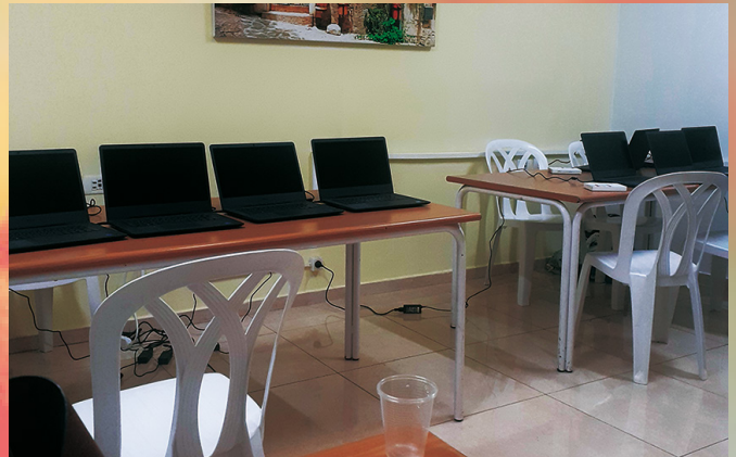
Es wurden neue Computer angeschafft und für den Unterricht im Lernbereich installiert.

„Denn ich weiß, was für Gedanken ich über euch habe, spricht der HERR ...“ (Jeremia 29,11)