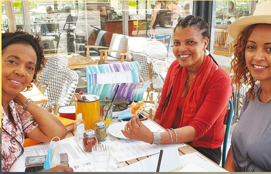
Bei der Ausbildung