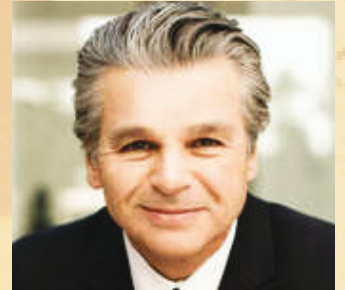
Pastor Jentezen Franklin

Pastor Jentezen Franklin von der Free Chapel Kirche in Gainesville, Georgia, hat uns freundlicherweise den gesamten Vorrat unseres neuen Ladens zur Verfügung gestellt, der bis zum Überlaufen mit neuen Artikeln gefüllt ist, die für die zurückkehrenden Familien in Israel benötigt werden. Bitte beten Sie darüber, uns zu helfen. Unser neues Projekt läuft unter der Schirmherrschaft von Offene Tore . Geben Sie bei Spenden dafür bitte an: „ Operation Start-Up/Olim “. Möge der Herr, der Gott Israels, überall auf der Welt Liebhaber Zions erwecken, die uns dabei helfen, eine neue Zeit des Gebens aus dem Herzen der Christen, die dem Herrn Jesus folgen, aufzubauen.