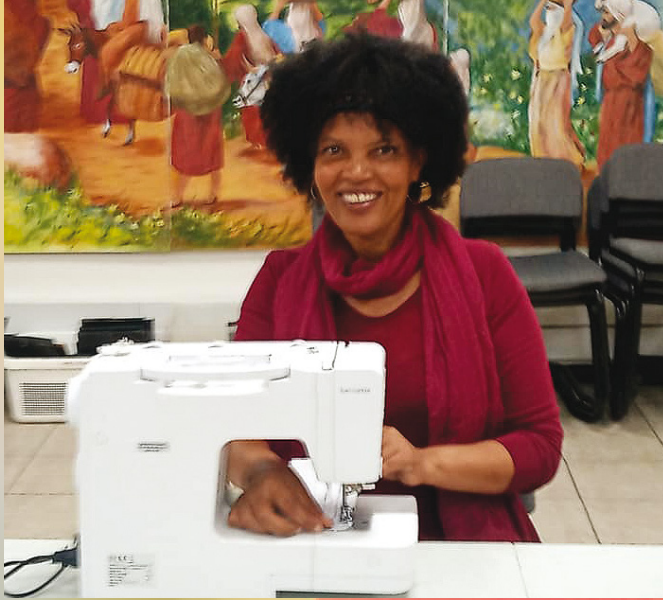
Das Bildungszentrum ist mit brandneuen Nähmaschinen ausgestattet

„Denn ich weiß, was für Gedanken ich über euch habe, spricht der HERR ...“ (Jeremia 29,11)