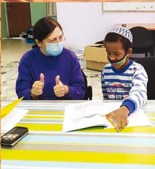
Lernen ist so wichtig

Als äthiopische Juden in den 1990er Jahren nach Israel kamen, war CFI einer der ersten christlichen Dienste, der sich um die Neuankömmlinge kümmerte. Wir waren auf der anderen Straßenseite des Absorptionszentrums in Mevasseret Zion stationiert. Das war für uns sehr praktisch, um unsere Besuche zu machen und mit den Gemeindeleitern zu sprechen, um herauszufinden, was zu dieser Zeit am dringendsten benötigt wurde. Unser Einsatzprogramm trug den Titel „Together Again“ (Wieder Vereint), da viele Familien in Äthiopien zurückgelassen worden waren und nach und nach erteilte Zulassungen die Menschen wieder zusammenführte. Es war wunderbar, das Engagement und die Liebe zu dem Land zu sehen, in das sie zurückkehrten. Das war inspirierend und ermutigend.