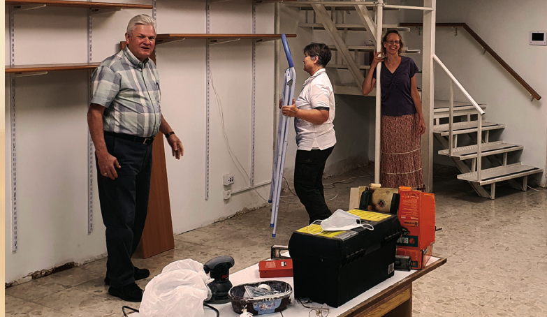
Planungsphasen des Ladens

Seit der Gründung von CFI im Dezember 1985 haben wir Beziehungen und Zusammenarbeit zwischen Juden und Christen aufgebaut und uns auf viele neue Arten verbunden, wie es vor der Gründung des jüdischen Staates noch nie der Fall gewesen war. Wir gehören zu den Pionieren, die Israel mit bedingungsloser, unhinterfragender und uneingeschränkter Liebe lieben. Und warum? Weil Jesus uns alle liebte, bevor wir Ihn kannten. Er zeigte